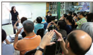
2011年08月12日，公民教育手語班華員會上堂實況