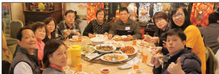
2012年3月11日，龍耳會員參與逍遙生態遊後，一同享用豐富午餐！