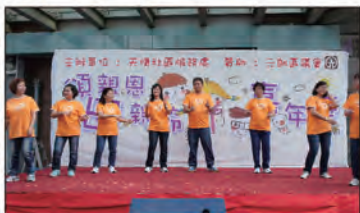
2012年05月12日母親節嘉年華演